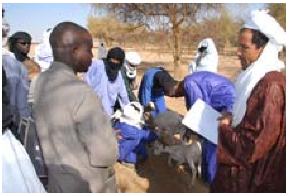
Remise du premier né dans le site d'Ibounkar Neklan en présence d'Ibrahim, des animateurs de Masnat et du vétérinaire de la Direction Régionale du Ministère de l'Elevage

L'importante mission de « prêt d'animaux » s'est terminée au 2 ème semestre 2009 : elle a permis de remettre, sur 29 sites, à des familles en difficulté, 750 vaches, plus de 1 800 moutons et plus de 1 500 chèvres. Cette action, qui a été un véritable ballon d'oxygène pour cette région, obligeait chaque famille bénéficiaire de remettre le premier né à une autre famille désignée dès le départ ; cette remise est appelée « restitution » ou « rotation ». La dernière restitution s'est faite début mars 2010.