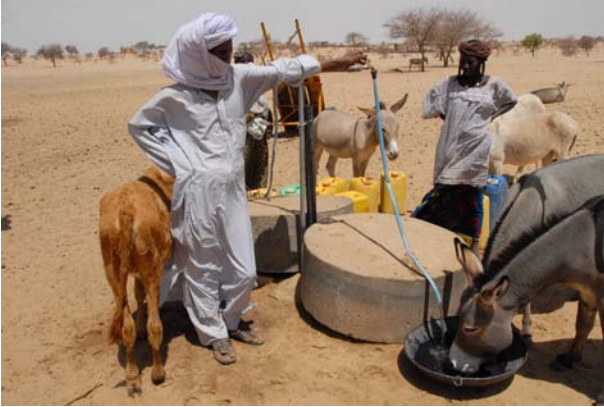
Point d'eau avec deux robinets pour les particuliers