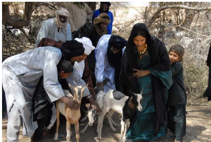
Restitution au site de Koulan