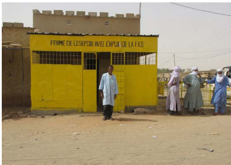
La nouvelle boutique du lait de la Ferme à Abalak

En raison de la faible pluviosité en 2009, cette année sera très difficile pour les animaux de la Ferme. Les coopérateurs ont réduit le cheptel afin d'éviter au mieux les pertes. La ferme continue néanmoins à produire du lait, mais en moindre quantité en attendant des jours meilleurs.