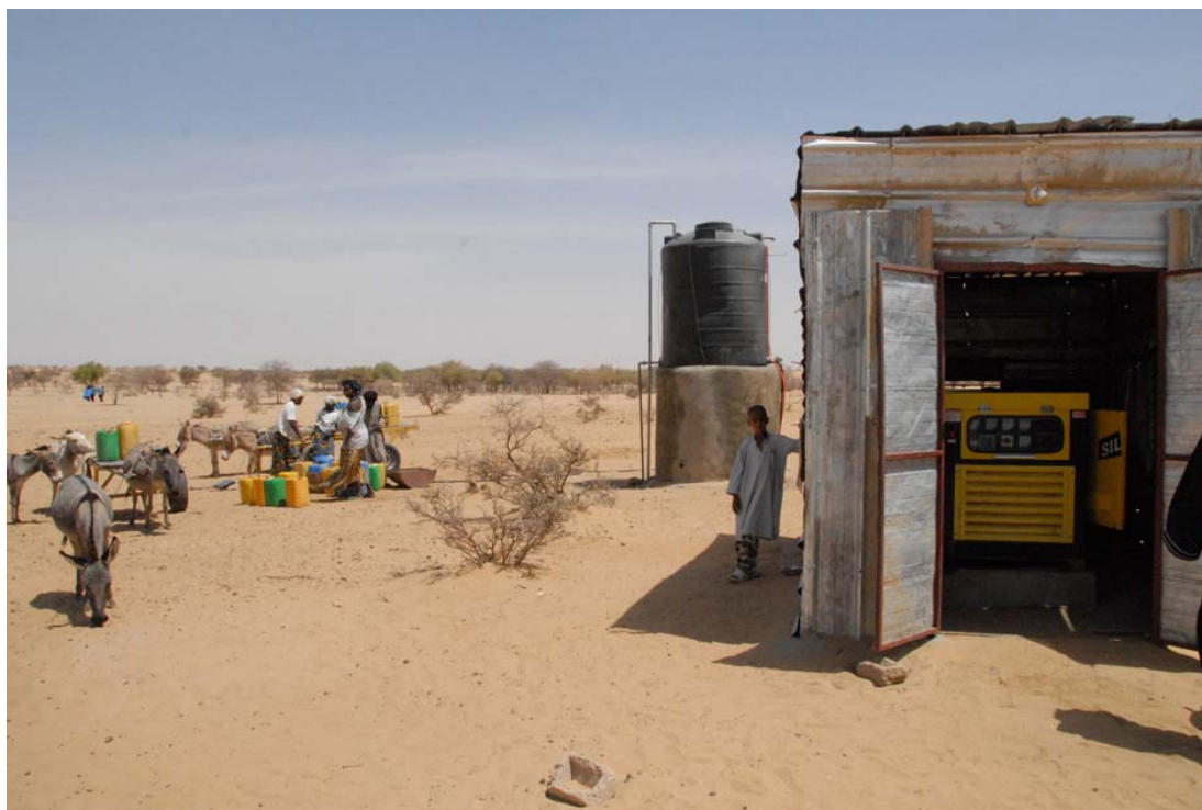
Le cabanon avec le groupe électrogène, le château d'eau et le deuxième point d'eau pour les particuliers

La longue aventure de la gestion ne fait que commencer.