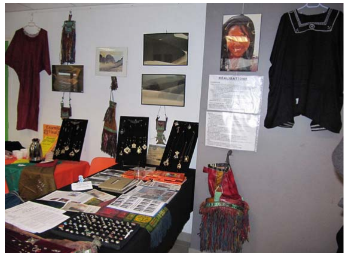
Marché de Noël à VENON