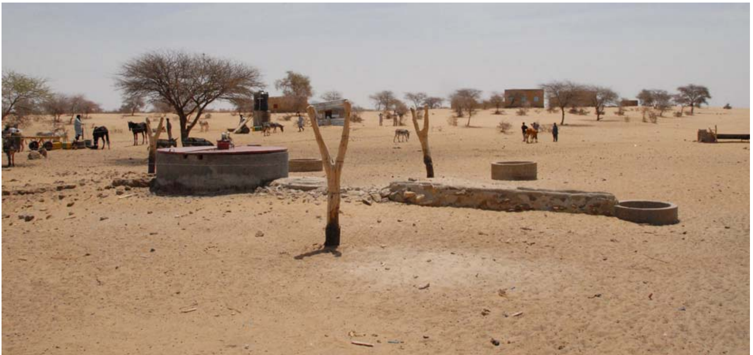
Les nouvelles installations : le puits avec son couvercle, à droite l'abreuvoir, à gauche le point d'eau avec deux robinets, au centre le château d'eau et le cabanon du groupe électrogène, au fond le village avec les deux bâtiments de l'école, le dispensaire et la maison de l'instituteur

Le bulletin d'information "ISALAN N'MASNAT" n°21 - avril 2010 est publié par l'Association MASNAT - Lieudit Planchon – 38610 VENON