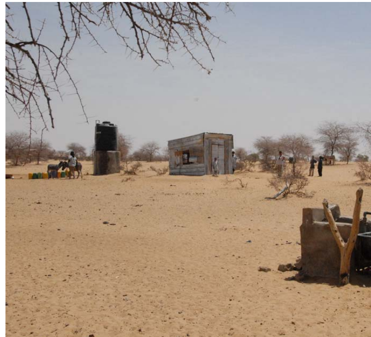
L'abreuvoir avec en arrière plan le château d'eau et le cabanon du groupe électrogène