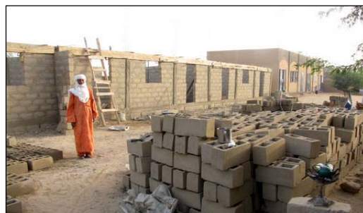
Construction d'un nouveau bloc de 2 classes et du bâtiment informatique.