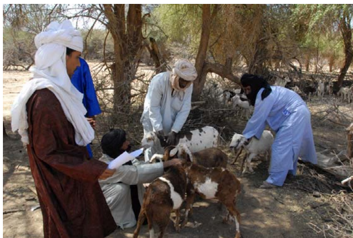
Restitution au site d'Ibounkar Neklan