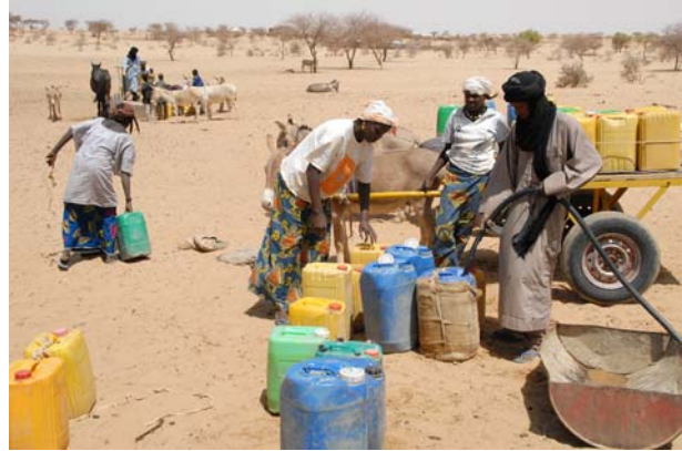
Deuxième point d'eau pour les particuliers avec un tuyau en direct du château d'eau : le gérant du puits assure lui-même la distribution